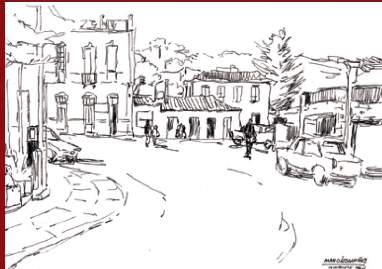
La Estación 1964