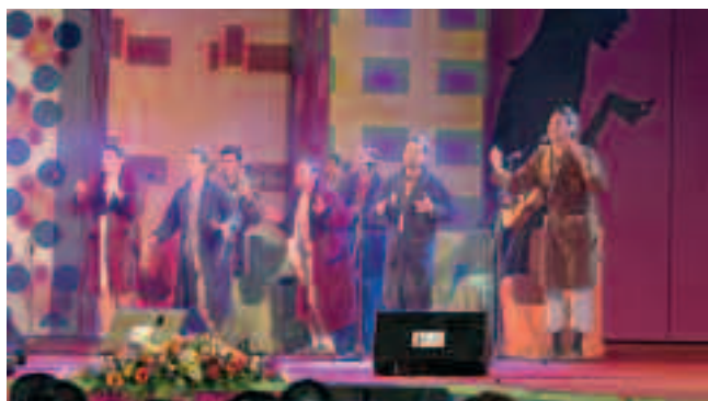
El espectáculo de la Gala dirigido por Pablo Afonso contó con la participación de la chirigota ganadora en los carnavales de Cádiz, Los Reyes del Mando